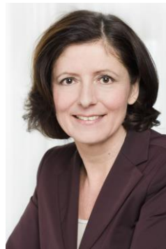
Ihre Malu Dreyer Ministerpräsidentin Rheinland-Pfalz

Ich wünsche Ihnen interessante Gespräche und Ihrem Kind eine gute Reise auf seinem Weg in den Beruf!